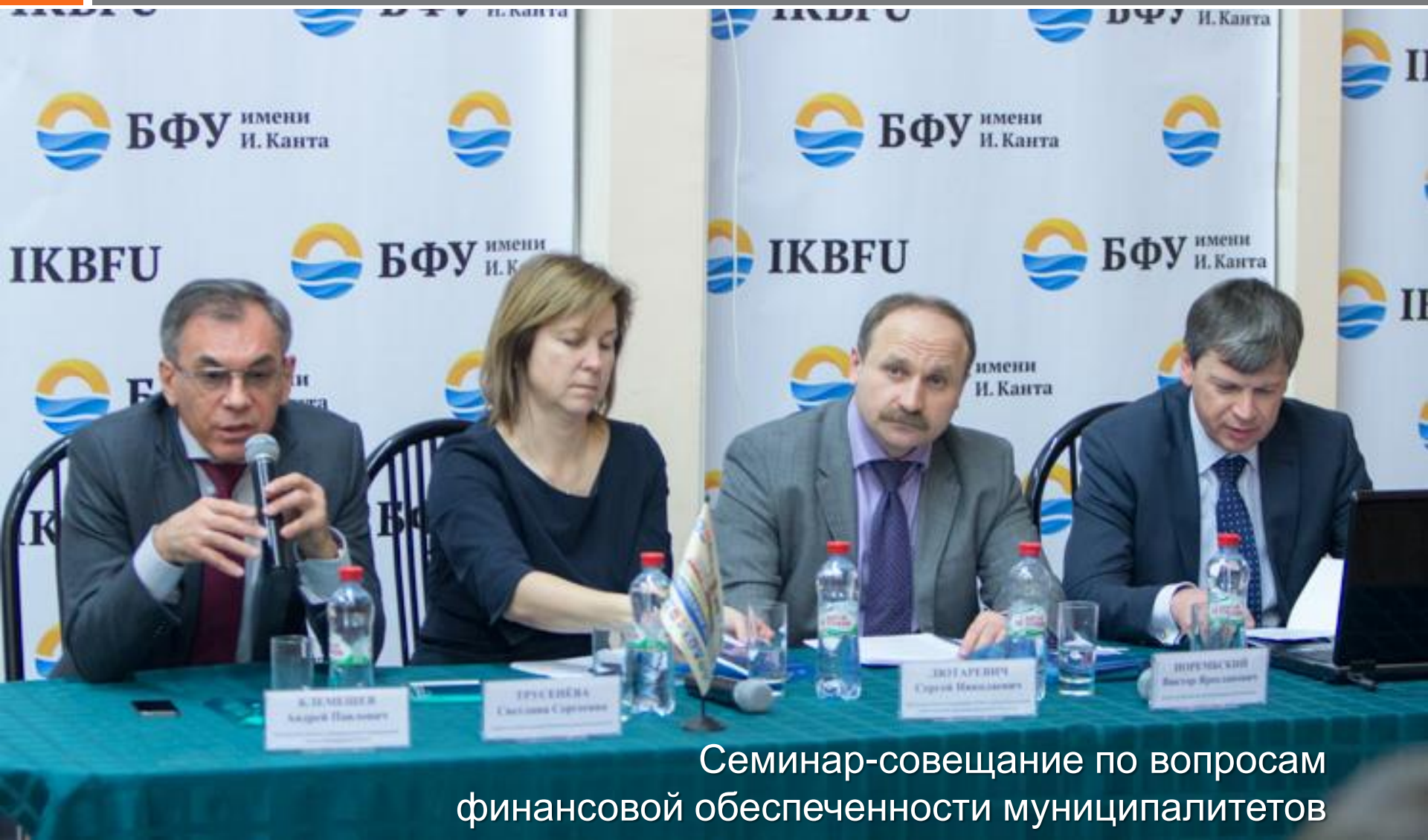
Семинар-совещание по вопросам финансовой обеспеченности муниципалитетов